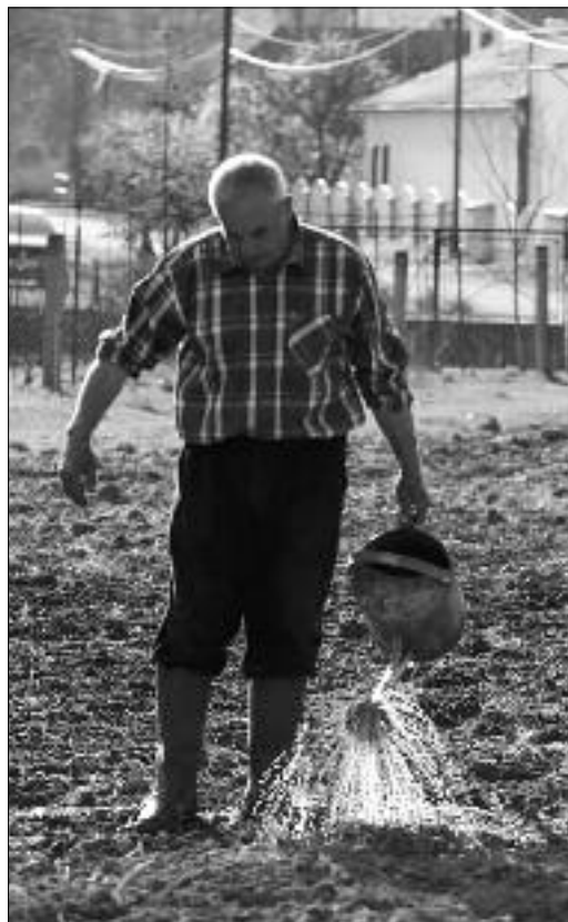
A nagypapa mindig várja az unokákat

Bízató és örömteli reményt ad, hogy megalakult a „Palócföldért” Alapítvány, és Herencsény élő hagyományaira, kiváló természeti, környezeti adottságaira mások is felfigyeltek. Se-