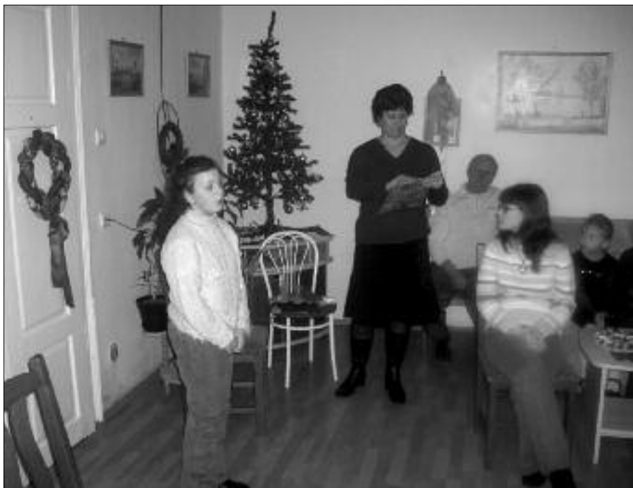
Örömet szerezni a legszebb feladat

Mint mondtam, sokszor előfordul, hogy én viszem az idős, mozgásukban korlátozott betegeket a kivizsgálásokra.